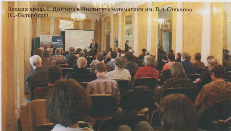
Лекция проф. Г. Циглера в Институте математики им. В.А.Стеклова (С.-Петербург)