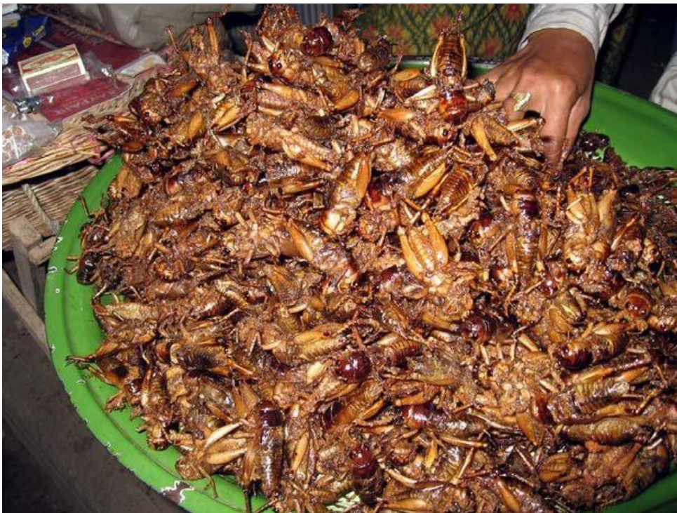
Abb.1: Frittierte Grillen/ Kambodscha

Die potentielle Rolle von Insekten für die Lebensmittelherstellung findet in der Wissenschaft und in den Medien immer mehr Beachtung. In Europa werden Insekten zwar bislang nur vereinzelt als Lebensmittel angeboten, weltweit wird der Etablierung von Insektenfarmen jedoch große Bedeutung für die Ernährung einer wachsenden Bevölkerung zugemessen. In vielen Ländern werden Insekten bereits traditionell von mehr als 2 Milliarden Menschen gegessen. Die Tiere werden meist in der Wildnis gesammelt, was sowohl eine starke Schwankung von Menge und Qualität in der Nahrungsmittelversorgung als auch eine Bedrohung einzelner Insektenarten durch zu starke Dezimierung der Wildbestände bedeutet.