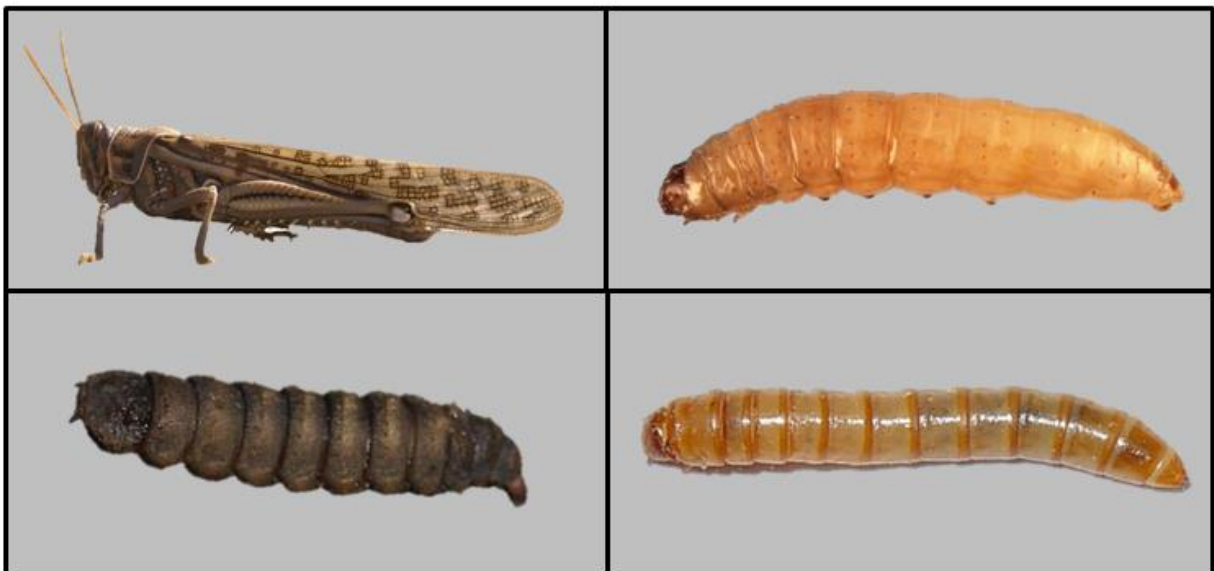
Abb. 2: Wanderheuschrecke, Larve der Wachsmotte, Larve der Soldatenfliege, Larve des Mehlkäfers (von oben links nach unten rechts),

Grundsätzlich sind Insekten eine hochwertige Nahrungsquelle mit hohen Protein- und Fettgehalten, reich an ungesättigten Fettsäuren, essentiellen Aminosäuren und Mikronährstoffen wie Vitaminen und Spurenelementen. Die für die menschliche Ernährung wichtigsten Arten stammen aus den Insektenordnungen der Heuschrecken und Grillen (z.B. Wanderheuschrecke, Abb. 2), der Hautflügler (z.B. Bienen, Wespen und Ameisen), der Schmetterlinge, bei denen die Raupen verzehrt werden (z.B. Wachsmotte (Abb. 2), Mopanewurm, Seidenspinner), der Käfer, hier werden wiederum die Larven verzehrt (z.B. Mehlkäfer, Abb. 2) oder der Fliegen, bei denen ebenfalls die Larven verwertet werden (z.B. Soldatenfliege, Abb. 2, Stubenfliege).