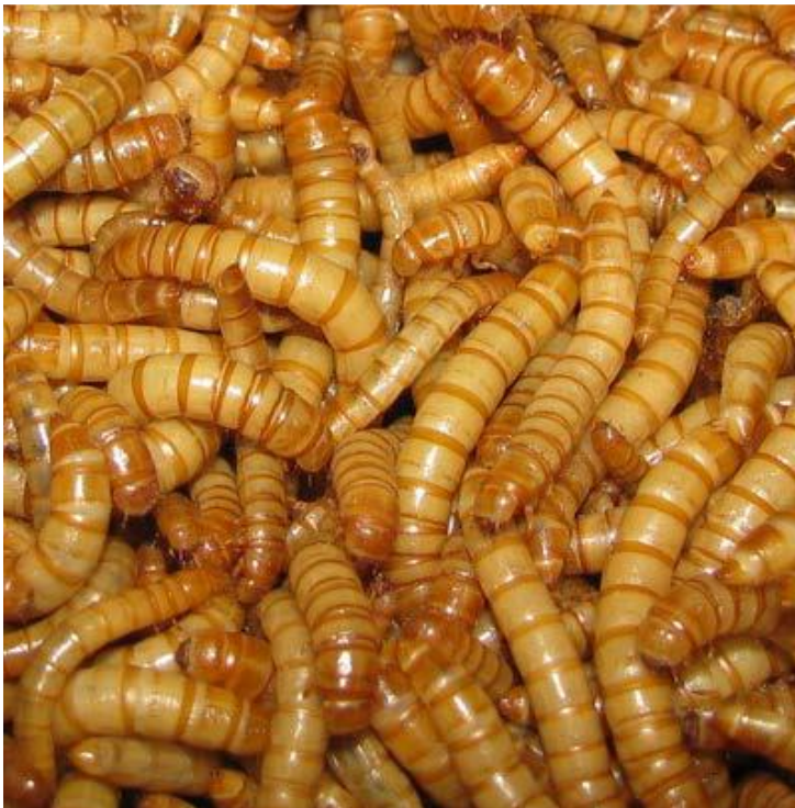
Abb.3: Mehlwurmzucht

Durch die Massenzucht von Insekten soll eine nachhaltigere Nahrungsmittelproduktion besonders von Protein erreicht werden, bei der im Vergleich zur herkömmlichen Nutztierhaltung möglicherweise weniger Ressourcen verbraucht werden. Ob eine nachhaltige Anzucht gelingt, ist, je nach Anspruch an Raumbedingungen, Futter und Temperatur, stark abhängig von der Insektenart, aber auch das Entwicklungsstadium ist von entscheidender Bedeutung. Viele Insektenarten bzw. bestimmte Stadien dieser Arten können auf engstem Raum gehalten werden, wie z.B. die Larve des Mehlkäfers, auch Mehlwurm genannt (Abb. 2 und 3), so dass eine Insektenzucht im Vergleich zur Haltung von Wirbeltieren weniger Platz beansprucht.